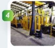
Affinage et alliage