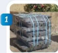
Plomb Doux 99.99 %