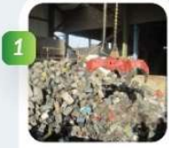
Réception des batteries