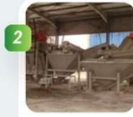
Broyage et séparation