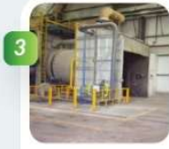
Réduction des oxydes