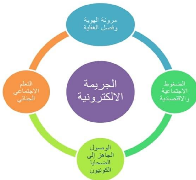
الملحق 02 : اسباب التطرف