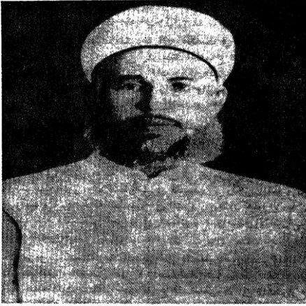
الشهيد الشيخ عز الدين القسام