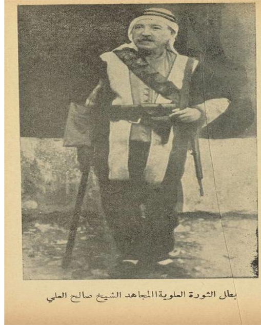
بطل الثورة العلوية المجاهد الشيخ صالح العلي