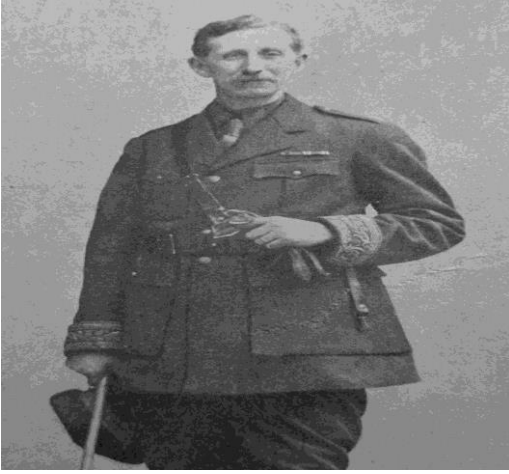
فرانسوا ماري دينيس جورج - بيكو (1870-)