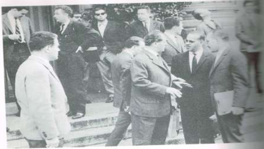
Rédha Malek devant la Maison de la presse avec Jean Amrouche (à gauche) et Sadek Moussaoui (à droite).

الملحق رقم (08) : الوفد الجزائري و وقف اطلاق النار وتوقيع اتفاقيات ايفيان الثانية (1)