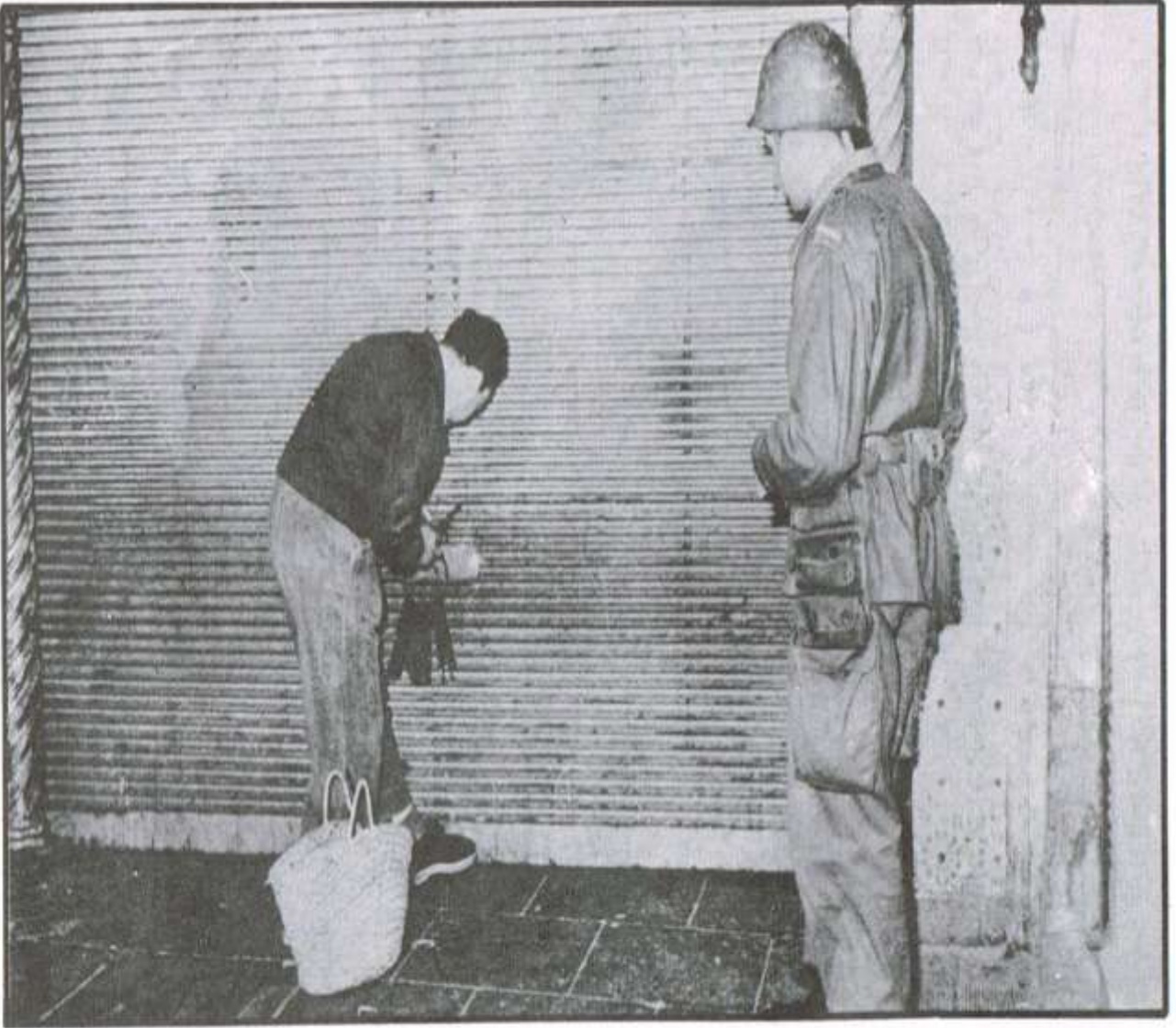
فرنسا تفتح مخازن التجار المضربين بالقوة