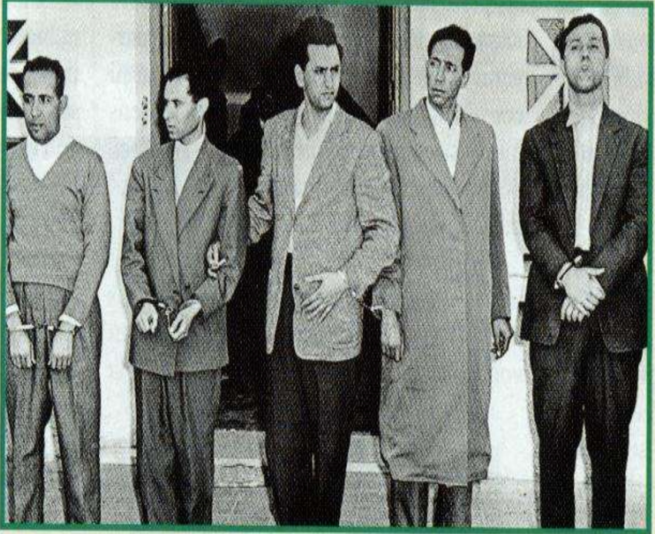
■ De droite à gauche : Ben Bella, Boudiaf, Aït Ahmed, Lacheref et Khider, photographiés le 24 octobre 1956, après le détournement illégal, par l'armée française, de l'avion les transportant au Caire.

الملحق رقم (6) : الوفد الجزائري المعتقل إثر عملية القرصنة الجوية (1)