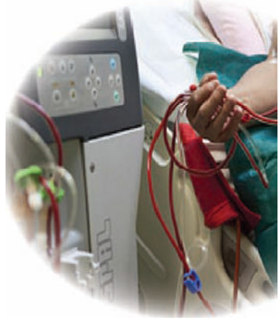
الشكل رقم 3: صورة توضح آلة تصفية الدم.