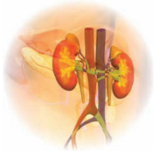
الشكل رقم 1: صورة توضح الكليتين.

هما غدتان تكونان البول وتفرزانه من الدم، فيصبح دم الإنسان نظيفا من المواد السامة أو الغير سامة التي يريد الجسم أن يتخلص منها لعدم حاجته لها.