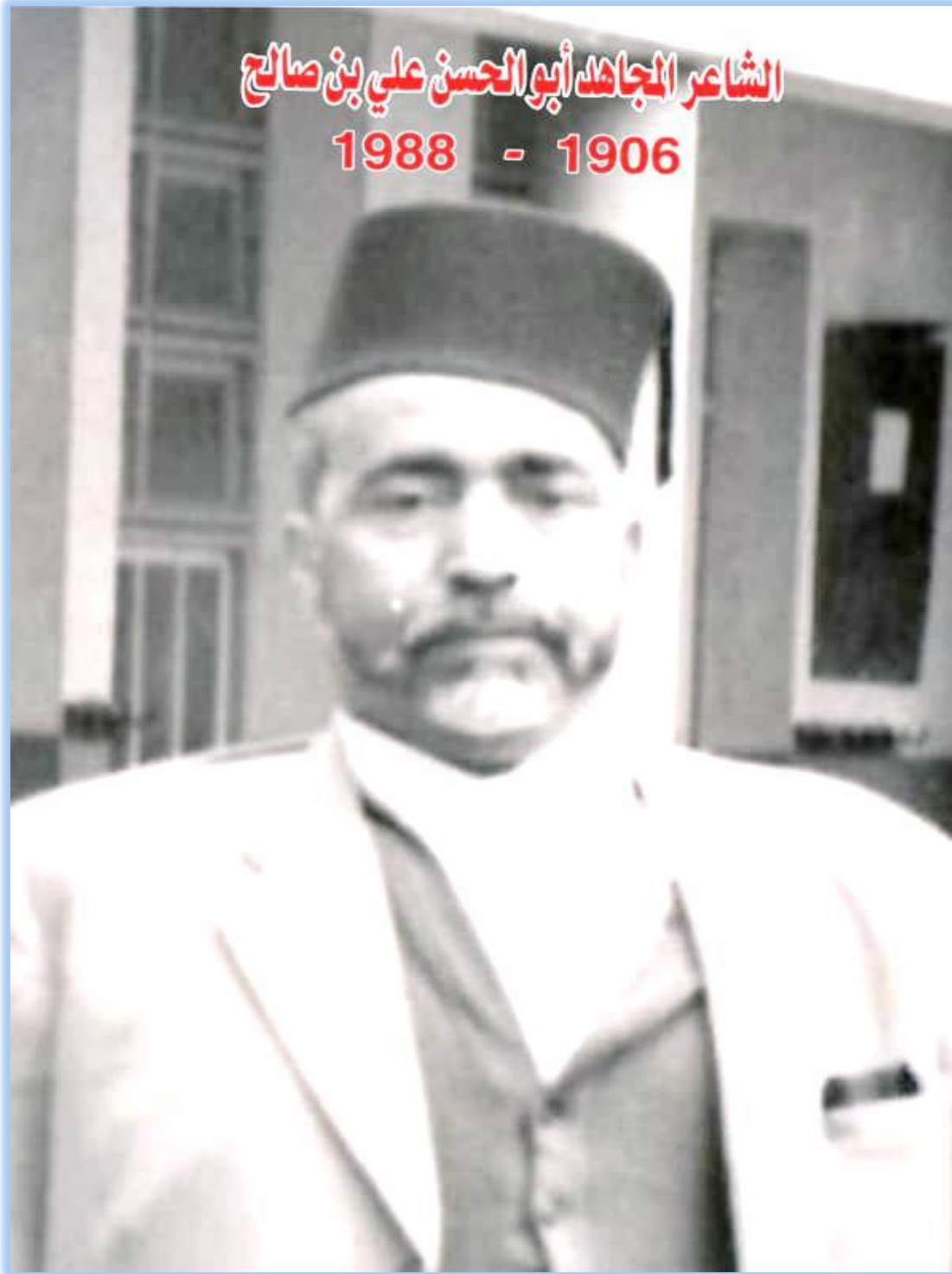
الصورة الشخصية للشاعر أبو الحسن علي بن صالح