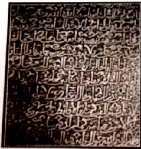
لوحة تذكارية تحفل بتاريخ بناء منارة الجامع الكبير بمدينة الجزائر من طرف أبو ناشفين الزياني سنة 723 هـ - 1323 م