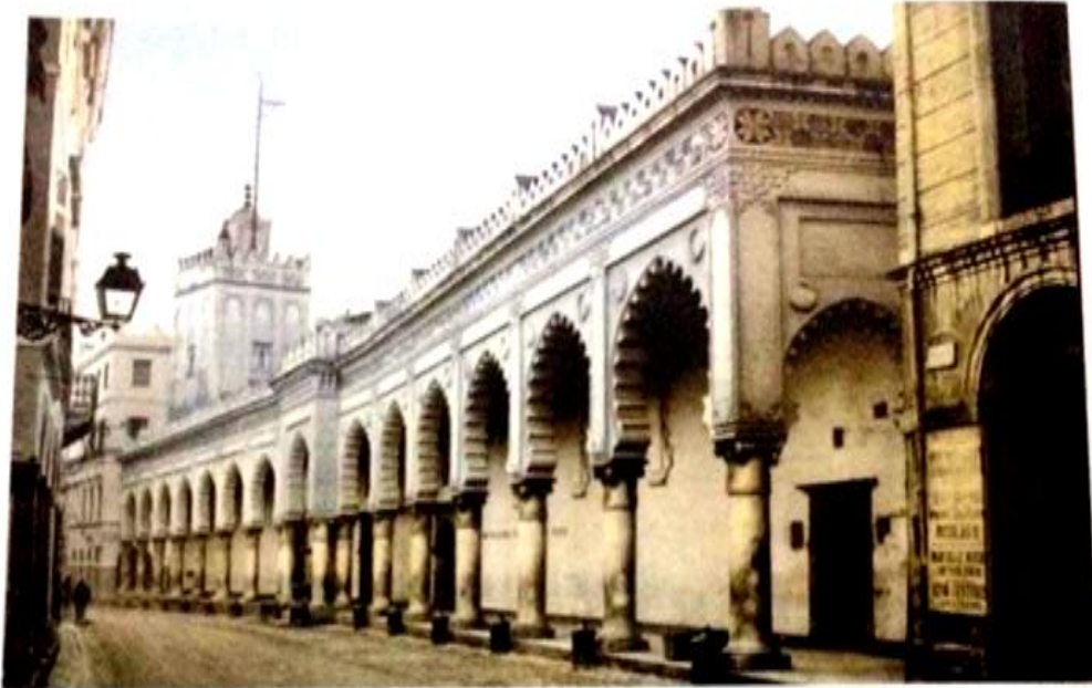
الجامع الكبير، منظر خارجي