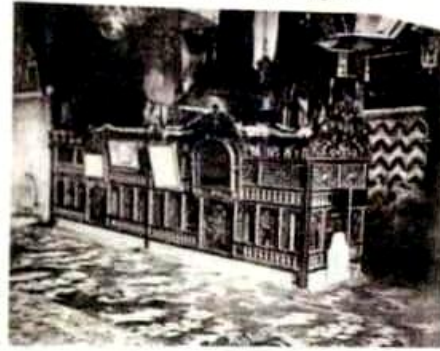
قبر سيدي عبد الرحمن