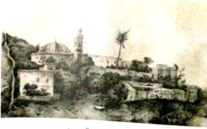
ضريح سيدي عبد الرحمن.