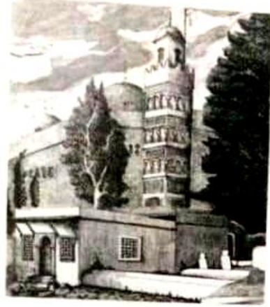
ضريح سيدي عبد الرحمن.