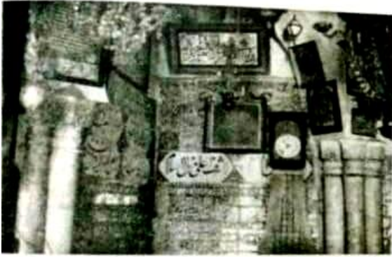
منظر داخلي لضريح سيدي عبد الرحمن.