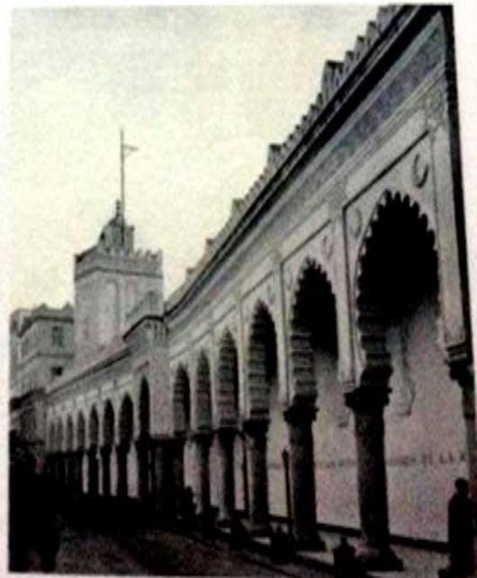
الجامع الكبير، منظر خارجي