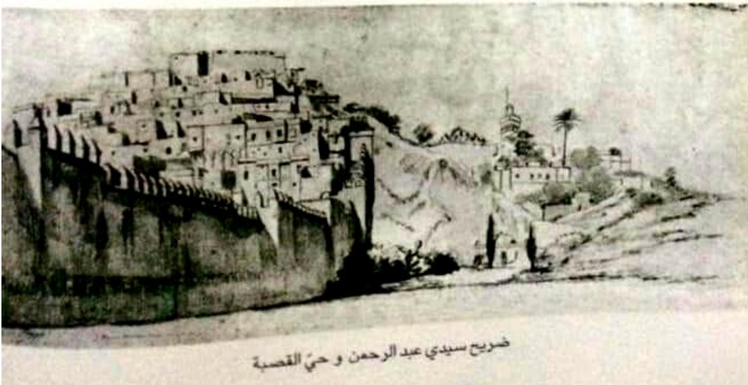
ضريح سيدي عبد الرحمن و حي القصبية