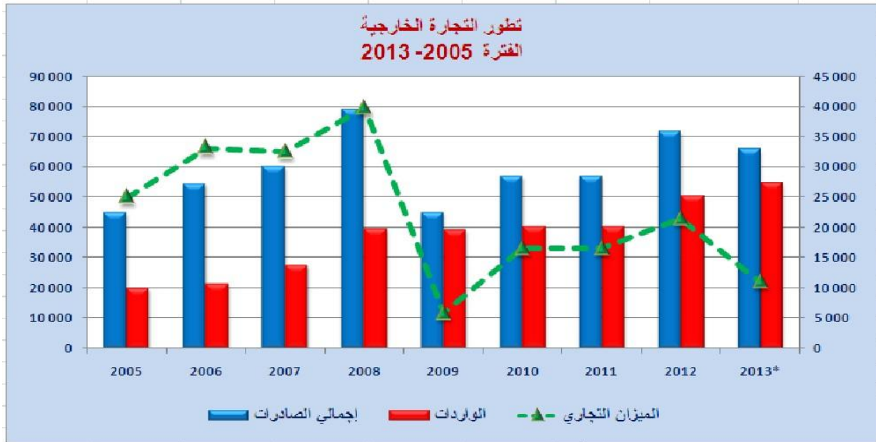
الشكل 01-02 : يمثل تطور التجارة الخارجية من 2005-2013

المصدر: http://www.andi.dz/index.php/ar/statistique/bilan-du-commerce-exterieur