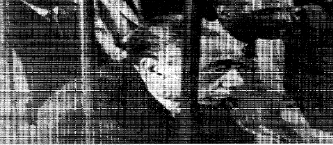
الشهيد سيد قطب خلف القضبان

الملحق رقم 07: صورة لسيد قطب خلف القضبان وأخرى في طريقه لغرفة الإعدام (1) .